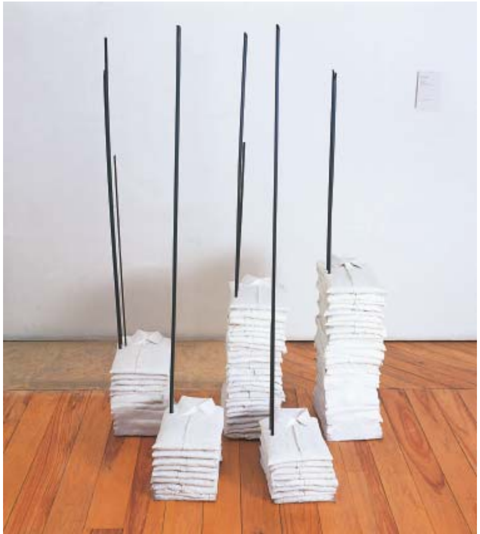
Doris Salcedo Sin título , 1990